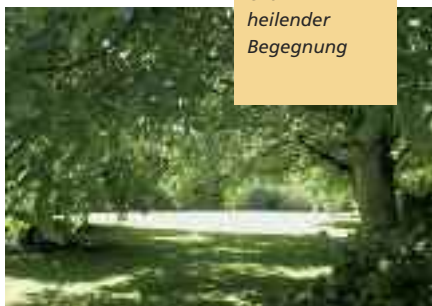
Ort heilender Begegnung