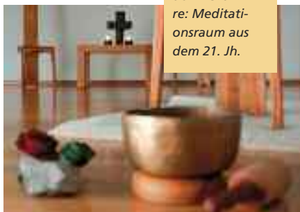
li: Kapelle aus dem 15. Jh. re: Meditationsraum aus dem 21. Jh.