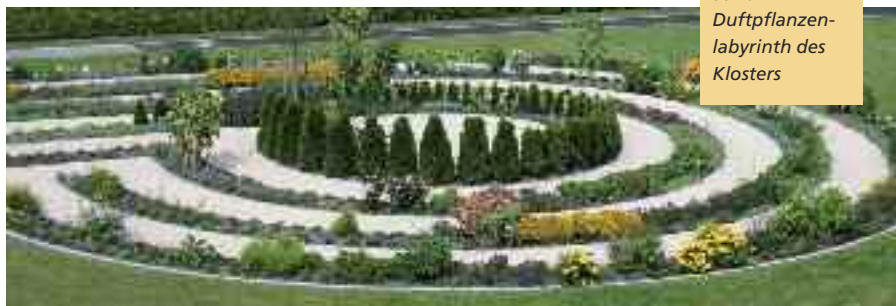
Erholsame Stille im Duftpflanzen- labyrinth des Klosters

Hinweise auf die Umgebung: das Kloster liegt in unmittelbarer Nähe zu bekannten Bäderorten und bietet einen günstigen Ausgangspunkt für Spaziergänge und (Rad-)Wanderungen (Fahrräder können im Haus gemietet werden). Zum Programm vieler Gäste gehört ein Ausflug in die „Sinn-Welt“ des ehemals zum Kloster gehörenden Jordanbads (Biberach) und zum Bodensee. Die anmutige oberschwäbische Kulturlandschaft mit ihren barocken Sehenswürdigkeiten ergänzt auf ideale Weise den Aufenthalt im Kloster.