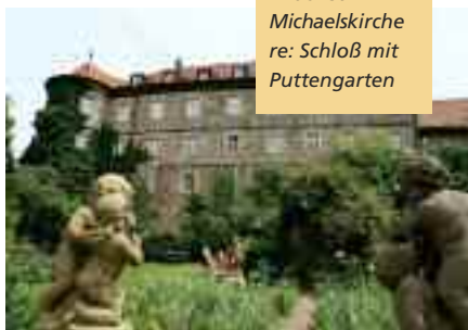
li: Brunnen in der St. Michaelskirche re: Schloß mit Puttengarten