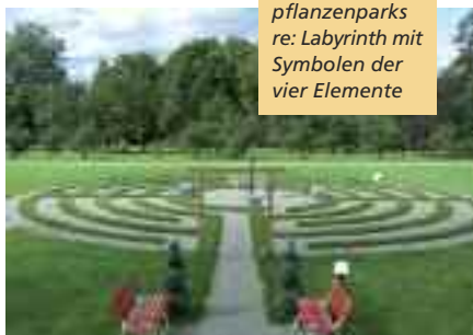
li: Biotop – ein Teil des Bibelpflanzenparks re: Labyrinth mit Symbolen der vier Elemente