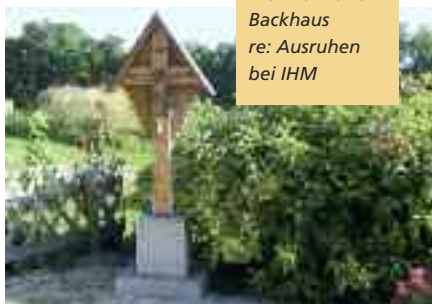
li: Idylle am Brunnen- und Backhaus re: Ausruhen bei IHM