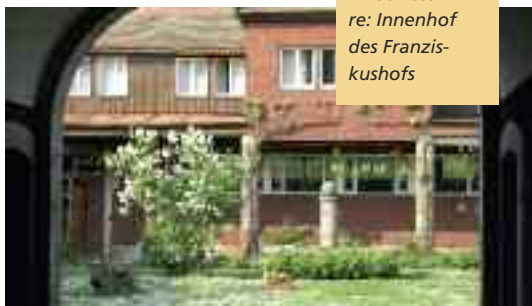
li: Kapelle im Schloss re: Innenhof des Franzis- kushofs