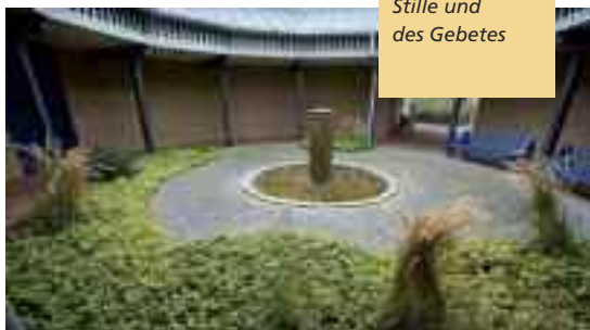
Orte der Stille und des Gebetes